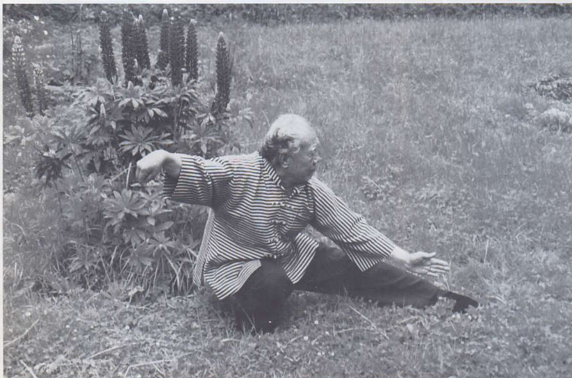
Duan ja Ta Chi asento "Käärme ryömil alas"

oman tyylinsä ohella myös tai chitä. Tämä ilmiö on nähtävissä myös usean karateopettajan kohdalla Japanissa ja länsimaissa. Mannerkinassa on pinnalla Wushu-tyylinen harjoittelu, joka lähinnä sopii nuorille. Monet vanhat mestarit kuitenkin opettavat perinteistä tai chitä. Mielestäni tai chi kuuluu kaikille ja kaikkien kiinnostuneiden pitäisi pystyä harjoittelemaan sitä. Tärkeintä on "sydän" tai tunne todellisesta yrityksestä ja ponnistelusta.