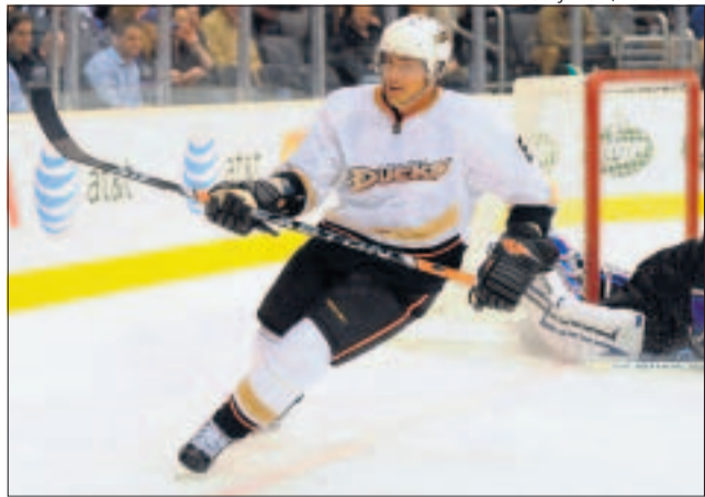
Pitkän uran tehnyt Teemu Selänne myöntää, että ikä alkaa jo painaa luistimissa.